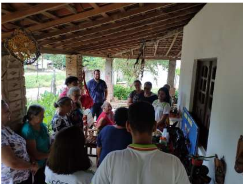
Figura 1. Oficina de preparos culinários com PANC feita com moradores do assentamento Nova Jerusalém (Maragogi/AL).