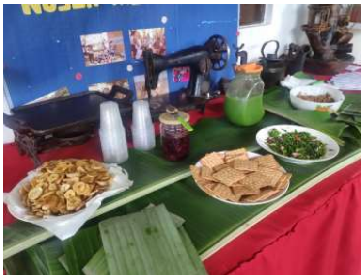
Figura 2. Mesa com preparos culinários contendo PANC.

A Figura 2 apresenta os pratos servidos na oficina no assentamento Nova Jerusalém foram: salada crua com brotos da folha de seriguela ( Spondias purpurea ), hortelã grande/grosso ( Plectranthus amboinicus ) e folhas de batata-doce ( Ipomoea batatas ); coração/mangará da bananeira e casca de banana ( Musa × paradisiaca ) refogados com verduras e temperos; chips de banana verde; suco das folhas de seriguela com um toque de limão; e geleia feita com pétalas de papoula/hibisco ( Hibiscus rosa-sinensis ). Os alimentos foram servidos em folha de bananeira.