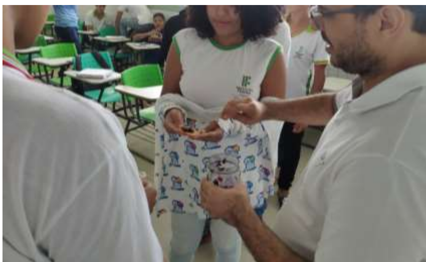
Figura 4. Degustação de geleia de papoula ( Hibiscus rosa-sinensis ) pelos alunos do curso de Agroecologia do campus Maragogi/IFAL.

Ao fim da oficina no assentamento Nova Jerusalém, as participantes foram questionadas sobre o que acharam dos conhecimentos repassados, e todas sinalizaram que gostaram, comentando que não sabiam que podiam utilizar na alimentação algumas plantas que elas têm ao alcance facilmente. Indicaram também que gostaram das informações divulgadas na cartilha educacional, e que iriam fazer as receitas em casa. Nas oficinas com os estudantes do curso de Agroecologia também ocorreu degustação (Figura 4), mas apenas da geleia de papoula.