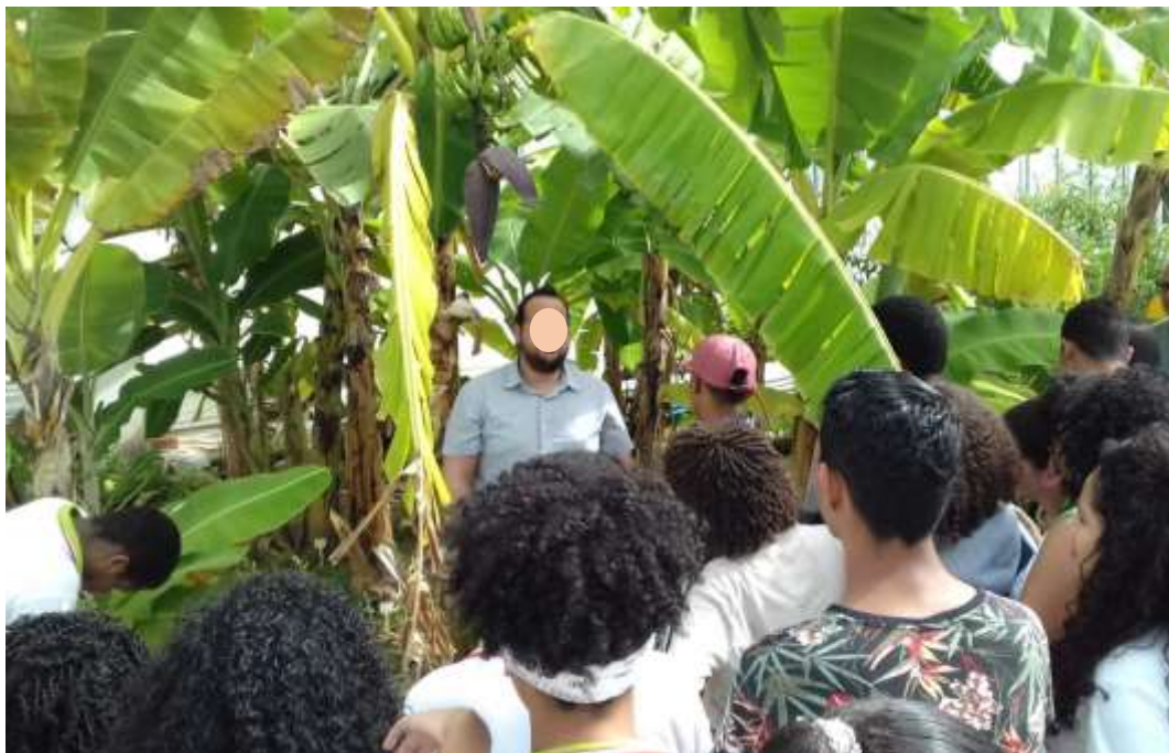
Figura 6. Explicações sobre o coração da bananeira em plantação existente no campus Maragogi/IFAL.