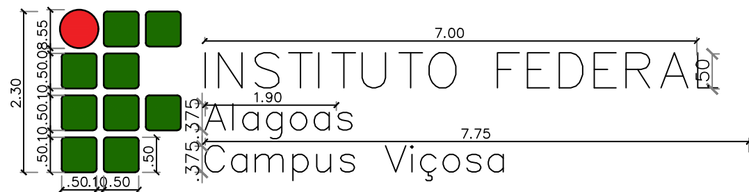
Letreiro de fachada

Descrição técnica: Letreiro em aço galvanizado com pintura preta