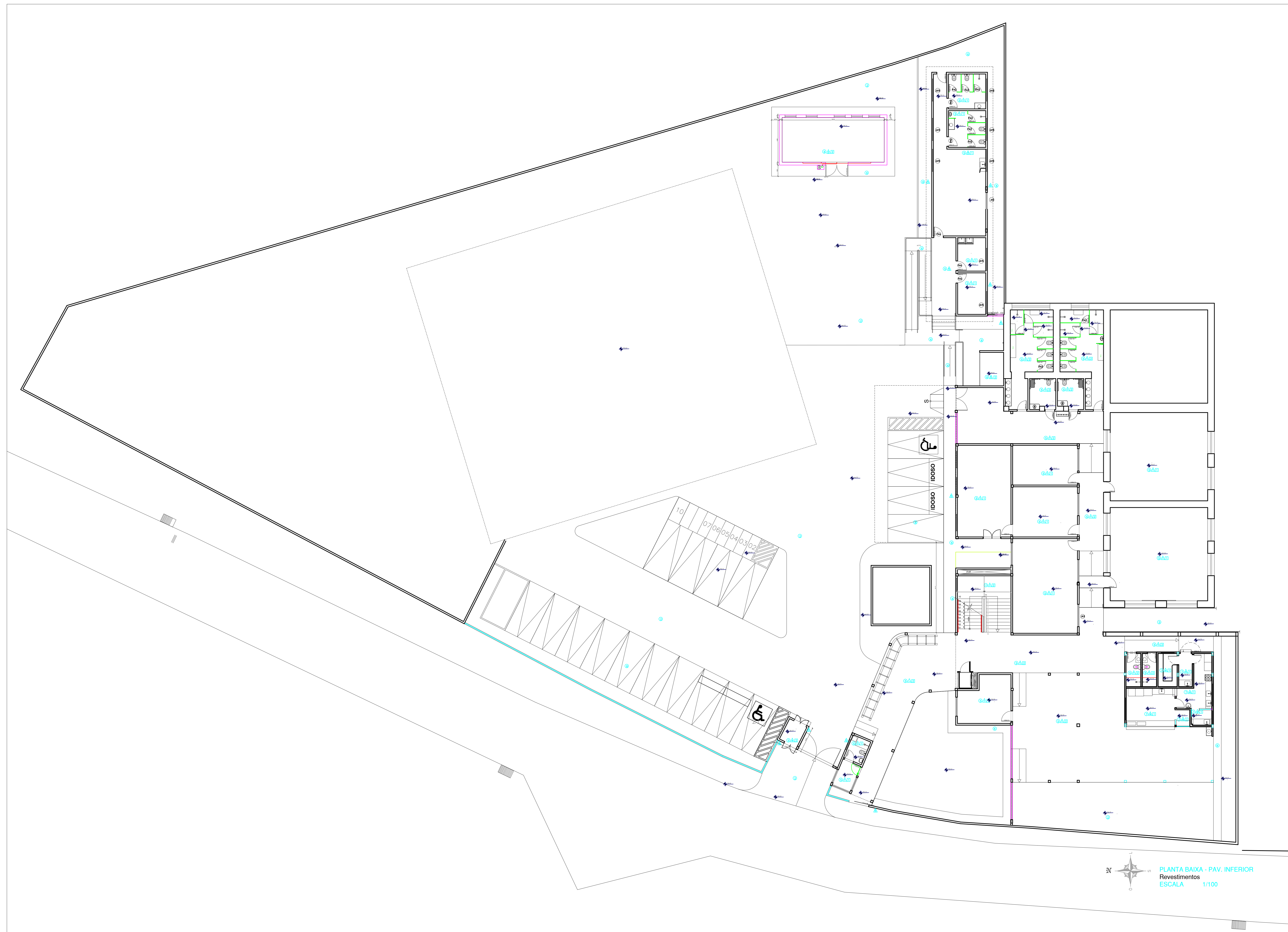
PLANTA BAIXA - PAV. INFERIOR Revestimentos ESCALA 1/100