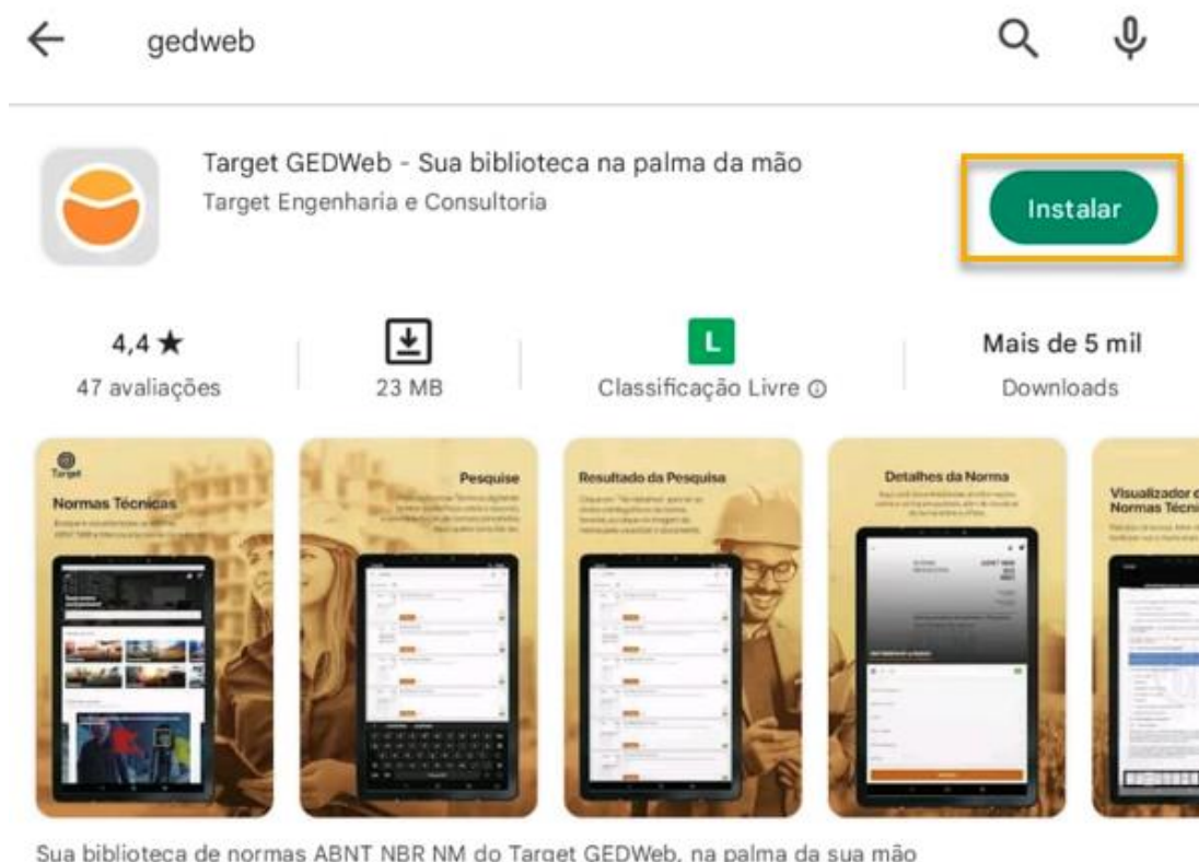
Sua biblioteca de normas ABNT NBR NM do Target GEDWeb, na palma da sua mão