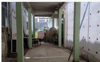
Fig. 1. Espaço físico em potencial para desenvolvimento do projeto de sala de apoio.