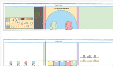
Fig. 4. Layout em cortes da distribuição dos mobiliários no espaço brincar, onde podemos perceber o uso de cores alegres, mas suaves que traz conforto e acolhimento ao ambiente o qual foi planejado pensando no melhor uso de todos.