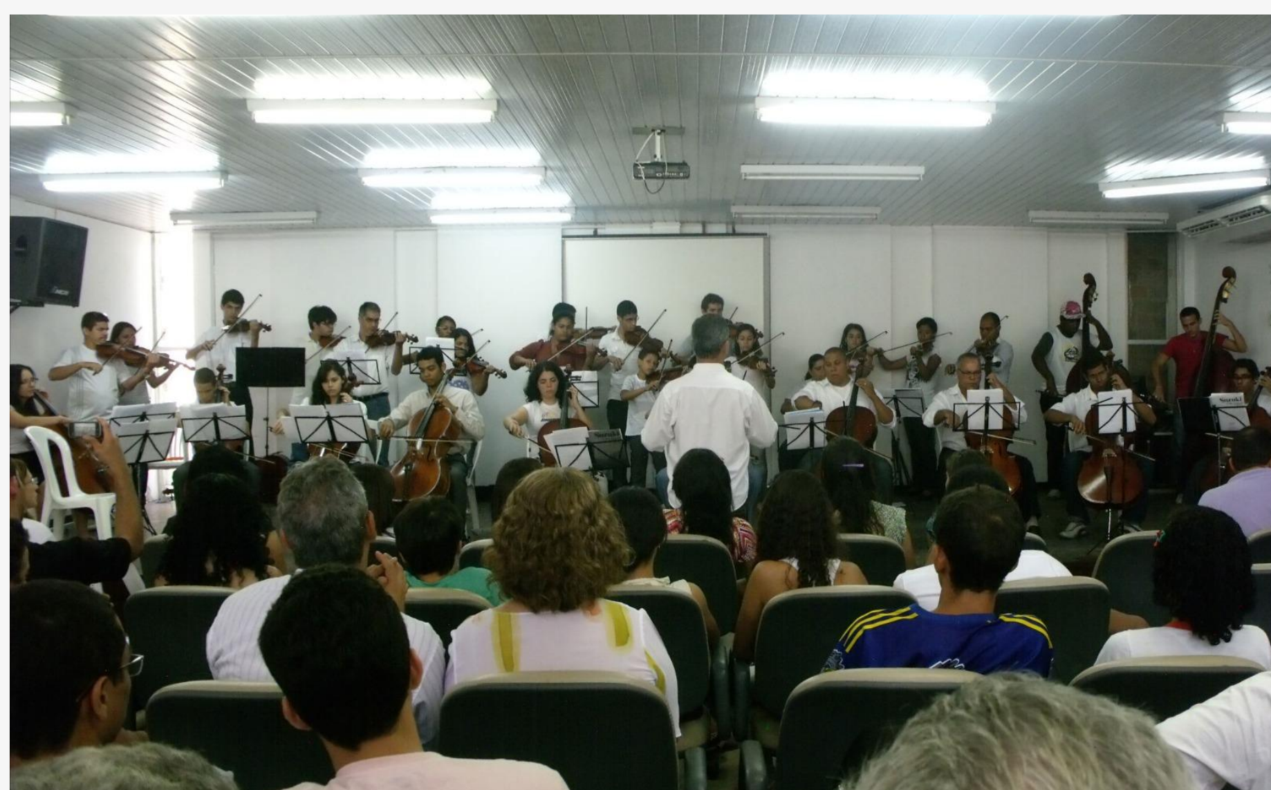
Fig. 1. "Audição do Núcleo de Arte e Cultura em 2011"