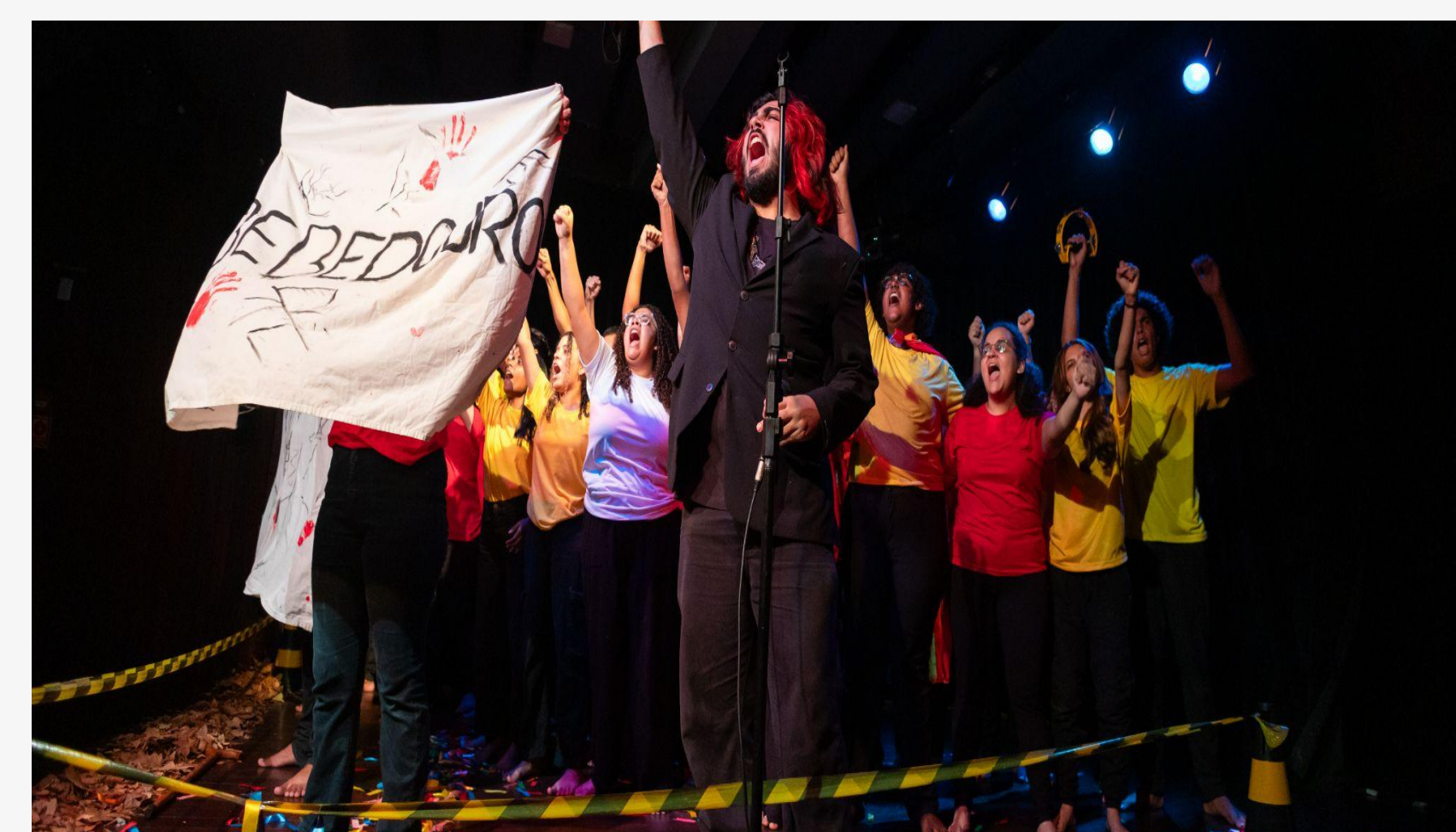
Fig. 3. "Espetáculo cênico musical Vilarejo, do Coro Jovem do Ifal"