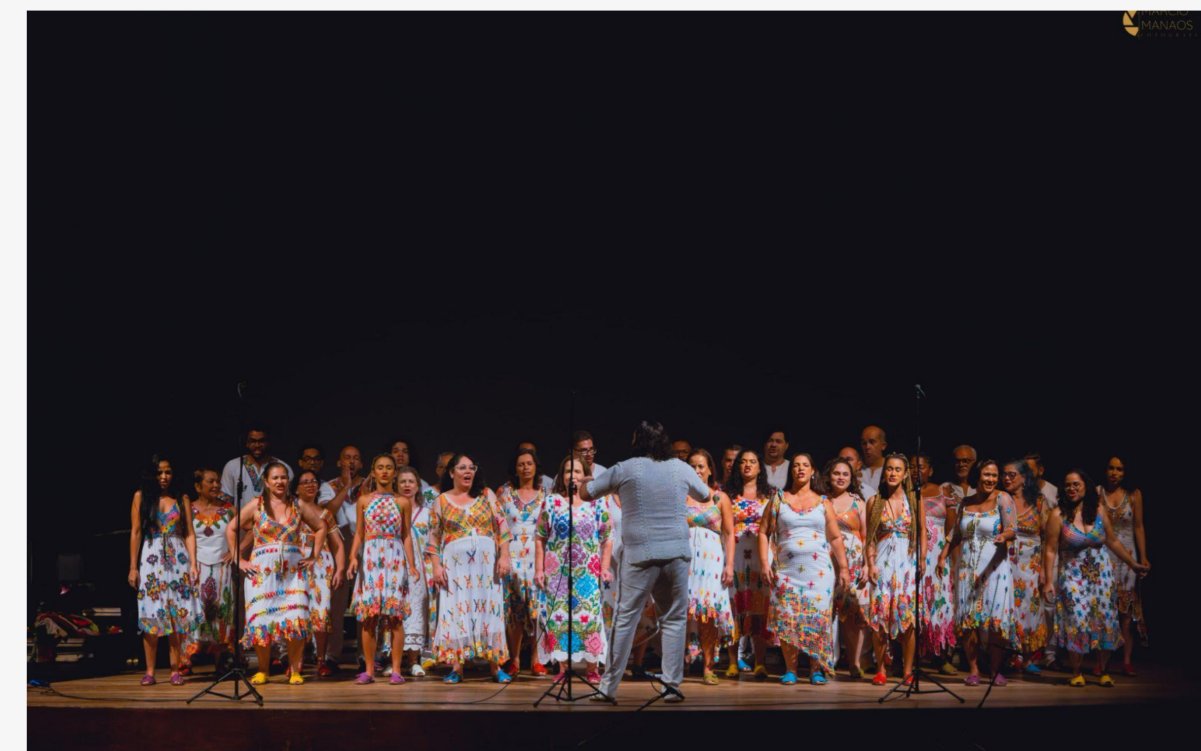
Fig. 2. Coretfa – Coral do Instituto Federal de Alagoas no Teatro Amazonas (Manaus - AM), em 2024..