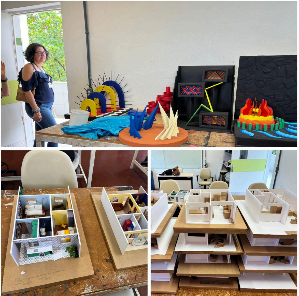
Figura 2: Registros da visita in loco da equipe da CPA e do Degrad ao curso de Design de Interiores.