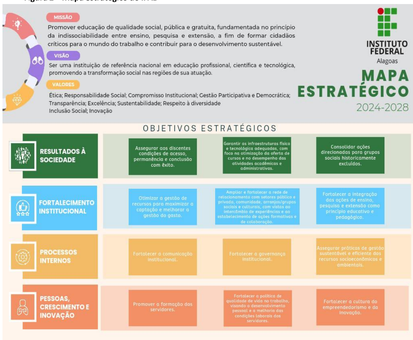
Figura 2 – Mapa estratégico do IFAL

Em 2024-2028, o IFAL reestruturou o Plano de Desenvolvimento Institucional - PDI, documento que identifica a instituição de ensino no que diz respeito à filosofia de trabalho adotada, à missão a que se propõe, às diretrizes pedagógicas que orientam as ações, à infraestrutura organizacional e às atividades que desenvolve ou pretende desenvolver. As comunidades interna e/ou externa tiveram a possibilidade de contribuir com a definição de objetivos e metas institucionais.