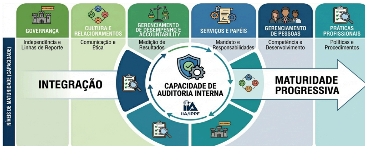
Figura 3. Elementos organizacionais que compõem a metodologia IA-CM